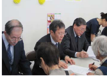
(左から) 西成田院長、矢嶋副院長、荒川企業長

昨年に引き続き、10月17日(土)にあきる野ルピアで開催された健康のつどいに参加しました。