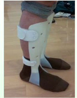
プラスチックAFO (湯の児式)