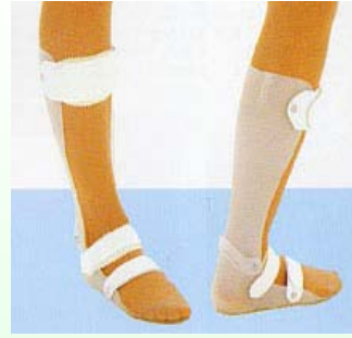
プラスチックAFO (足継手付き)