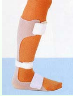
プラスチックAFO (靴べら型)