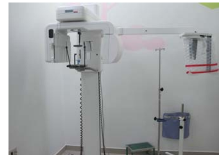
《セファロ撮影装置》